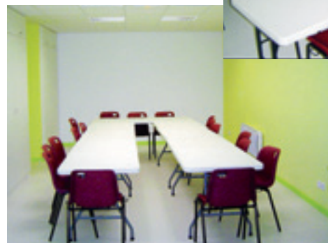
La salle « Associations »