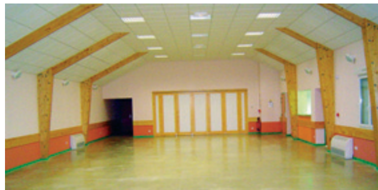
La salle des fêtes