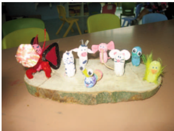
Activités manuelles réalisées par les enfants