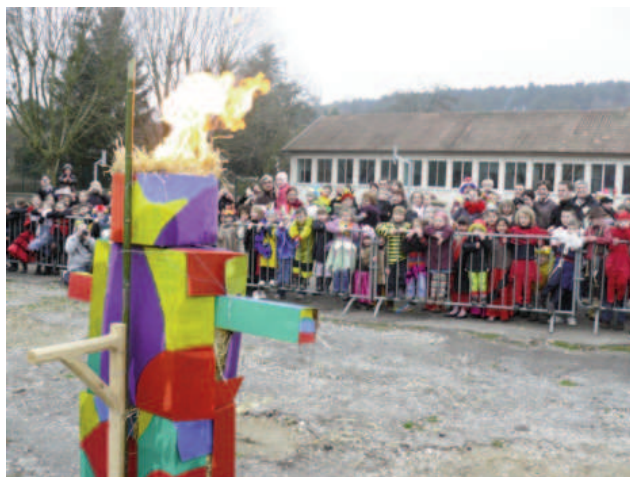
Embrassement de M. Carnaval