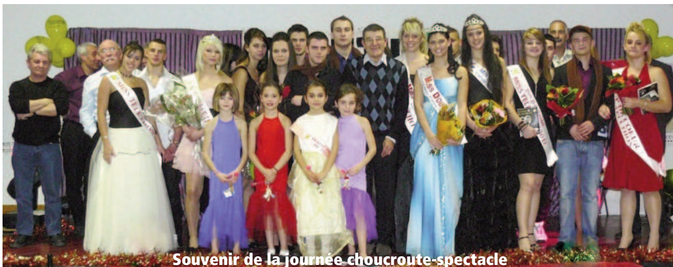
Souvenir de la journée choucroute-spectacle

Afin de donner un second souffle au Téléthon de Roulans, le comité d'organisation du Téléthon invite des volontaires à renforcer l'équipe.