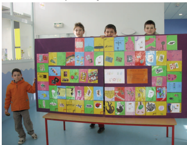
Été 2011 Création d'un jeu de l'oie géant