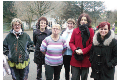
Les enseignantes et ATSEM