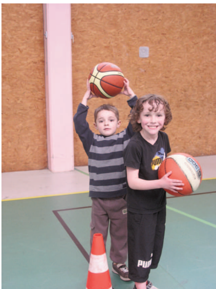
Initiation Basket – Mercredi Pass'loisirs