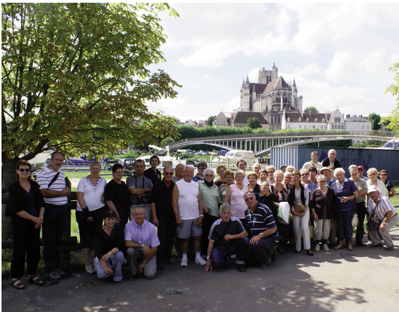
Photo souvenir du voyage en Berry et en Sologne

Le week-end du 21 et 22 Janvier, ce sera au tour des fêlés de la glisse de profiter des pistes de ski de Châtel et Avoriaz (covoiturage).