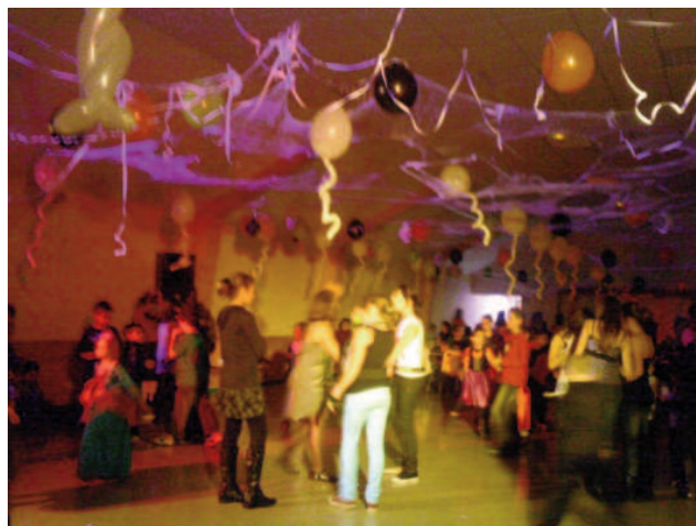
Soirée des vers luisants 23 octobre 2010

Noël 17 décembre: Après un goûter offert aux enfants de la maternelle et du primaire, le père Noël est venu écouter les petits chanter à l'Espace